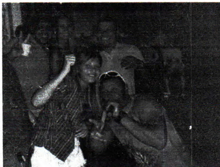
SHOW EM JUNDIÁ/AL