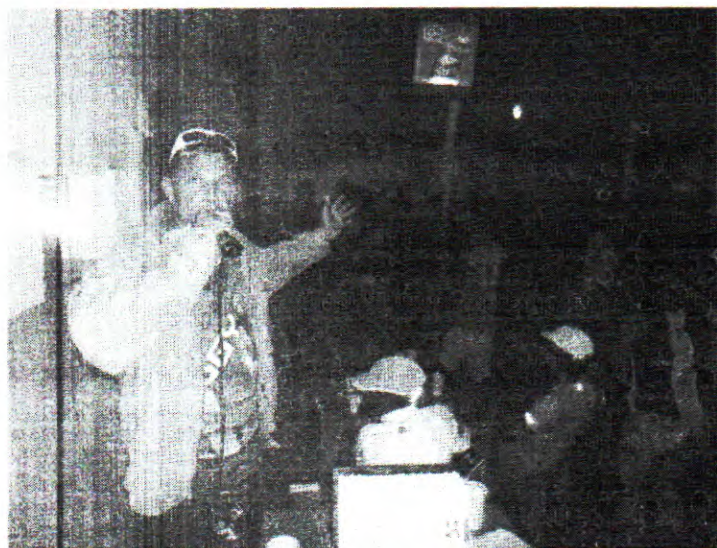
SHOW EM UNIÃO DO PALMARES/AL