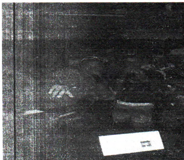
SHOW EM IBATEGUARA/AL