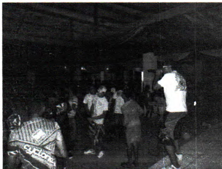
SHOW EM SANTO ANTÔNIO/ATALAIA